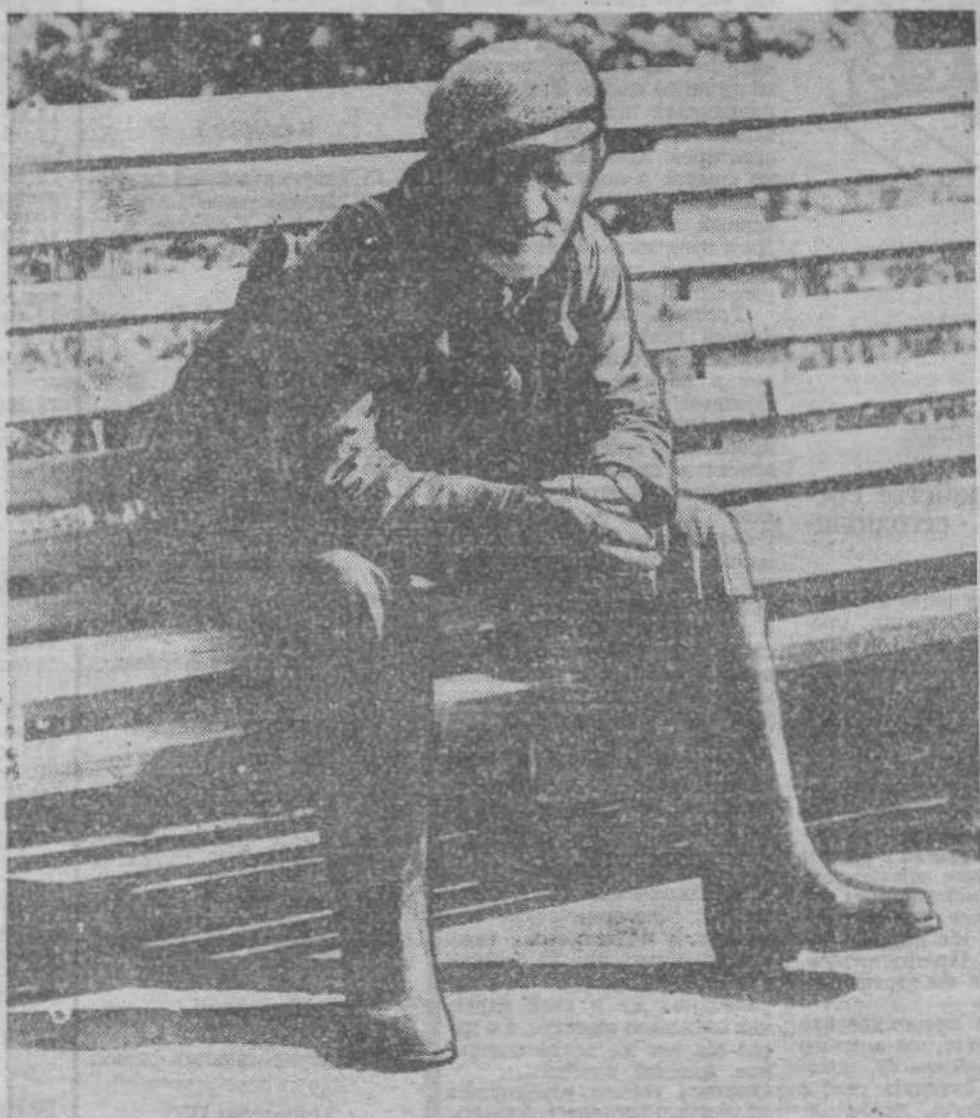
Кто он? Грибник? Турист? Нищий? Все мы теперь одинаковы...